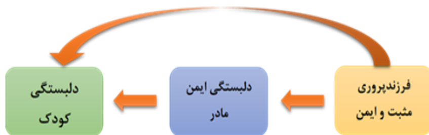
شکل ۱ مدل مفهومی پژوهش

همچنین، می‌توان با توجه به مؤلفه‌های سبک فرزندپروری مثبت و ایمن به پیش‌بینی سبک دلبستگی کودک پرداخت و در چگونگی ایجاد