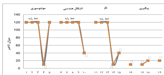
شکل ۱- نمودار آزمودنی شماره سه

○ : بیا با هم بازی کنیم - ▲: آوردن اسباب بازی نزد آزمایشگر - ▲: رفتن به سمت اسباب بازی و بازی به تنهایی - □: سلام دادن