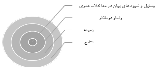
شکل ۲ الگوی گت و چهار لایه عملیاتی آن